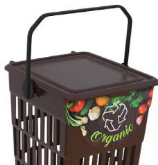
Con etiqueta residuo "Organic"