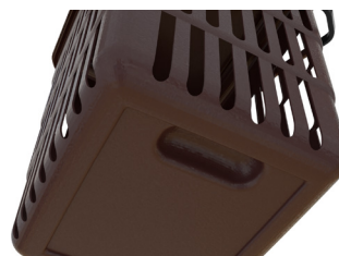
Hendidura en base que facilita la sujeción para el vaciado.