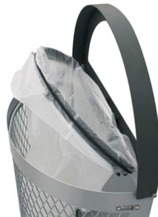
Detalle de apertura y aro interior sujeta-bolsas 90L semicircular