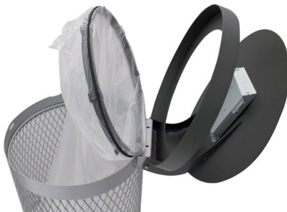
Detalle de apertura y aro interior sujeta-bolsas 120L y 90L circular