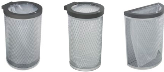
Marsella 120L circular